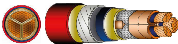
Tripolare Carta Tre Schermi – Three Core Screened Paper

Elenco dei kit disponibili per utilizzo con capicorda a crimpatura. Capicorda non inclusi. List of available kits suitable for crimp lugs. Lugs not included.